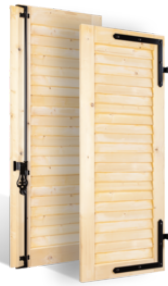
VOLETS BATTANTS 32mm à LAMES JOINTIVES en BOIS EN SAVOIR PLUS