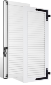
VOLETS BATTANTS 36mm à LAMES JOINTIVES en PVC EN SAVOIR PLUS